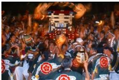
※祇園祭 素戔鳴神社げんか神輿