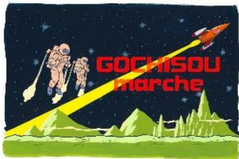
※惣菜部門デザインイメージ