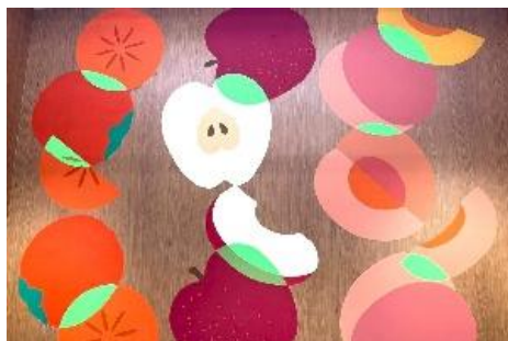
※青果部門デザインイメージ