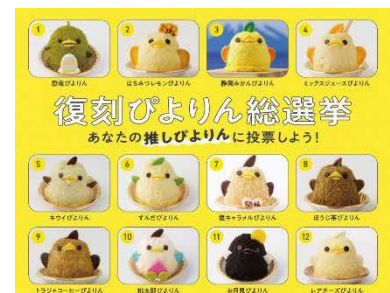
復刻ぴよりん総選挙 ビジュアル

過去限定ぴよりんとして登場したレパトリーはその数なんと300種類以上！今回はその中でも人気の高かったぴよりん達12種類を選定！皆さまの1票でお受け取りできるぴよりんが決まります！