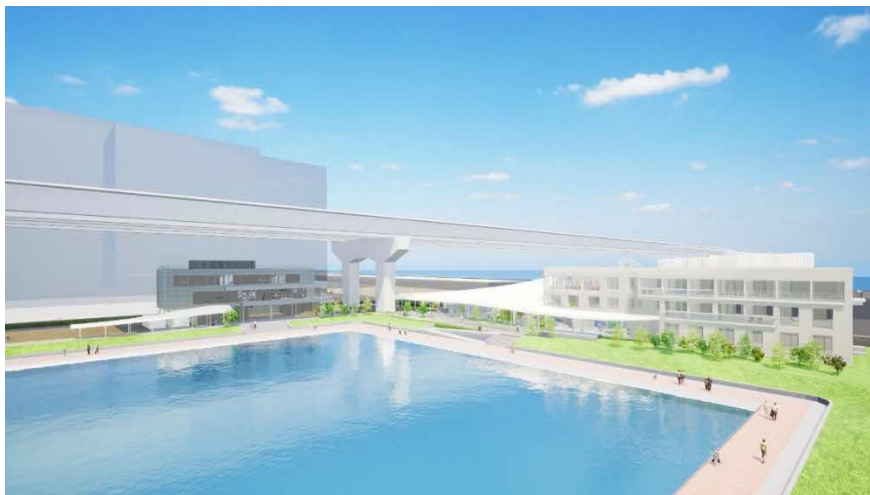
NAKAGAWA CANAL DOORS 全体パースイメージ

2026年6月18日（木）に開業する名古屋市・中川運河沿いの商業施設。東海初出店となるホテル「SETRE（セトレ）」や、飲食店、オフィス、スポーツ関連施設等を備え、名古屋都心の新たな水辺の交流拠点として、中川運河沿いのにぎわい創出を図ります。