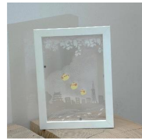
重ね絵アート（イメージ）