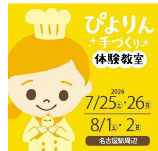
ぴよりん手づくり体験教室ビジュアル

一つ一つパティシエの手づくりによってデコレーションされているぴよりん。今回、パティシエと一緒に、その命を吹き込む作業とも言えるデコレーション（顔付け）体験を期間限定開催！作っていただいたぴよりんはその場でお召し上がりいただけます。あなただけのぴよりんを作りますか？