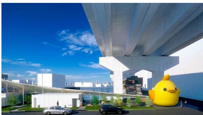
新幹線から見たイメージ