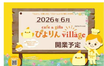
ぴよりんvillage開業予定 お知らせビジュアル