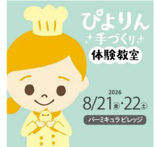
ぴよりん手づくり体験教室ビジュアル