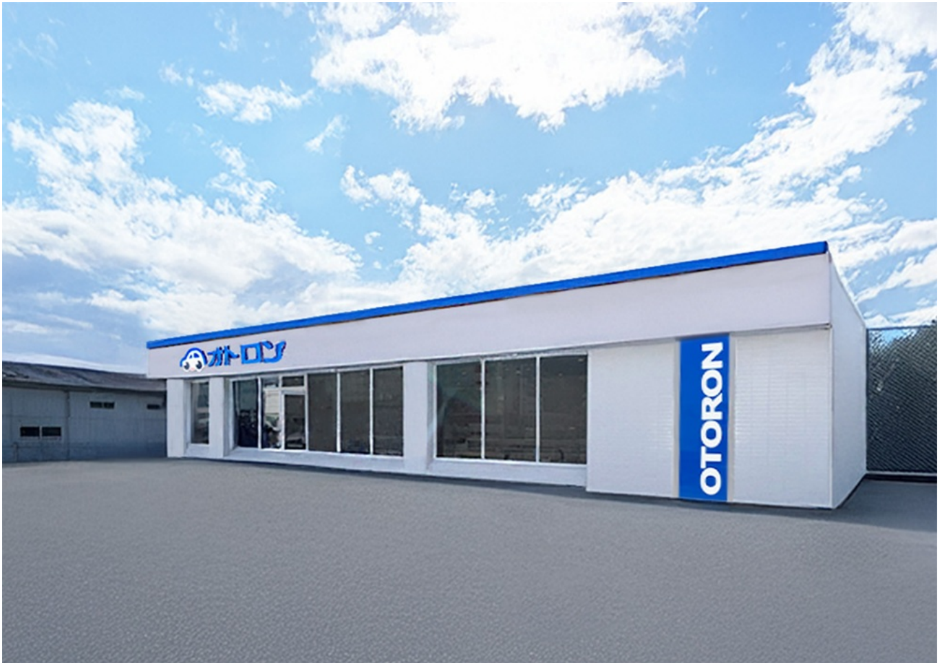
オトロンいわき店(外観イメージ)