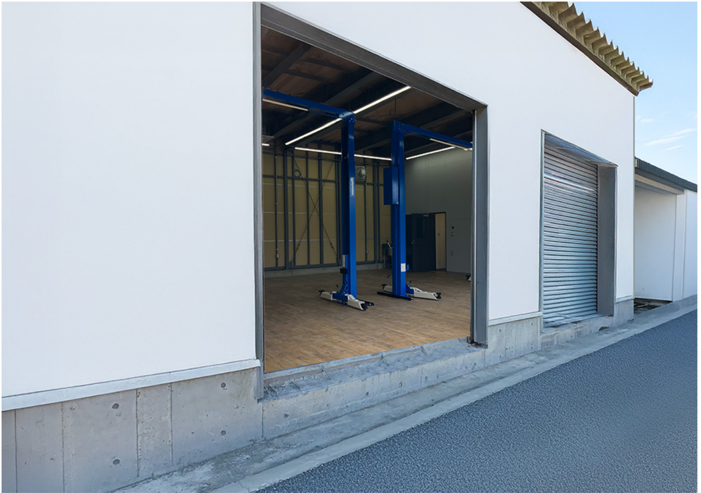
オトロンいわき店(工場イメージ)