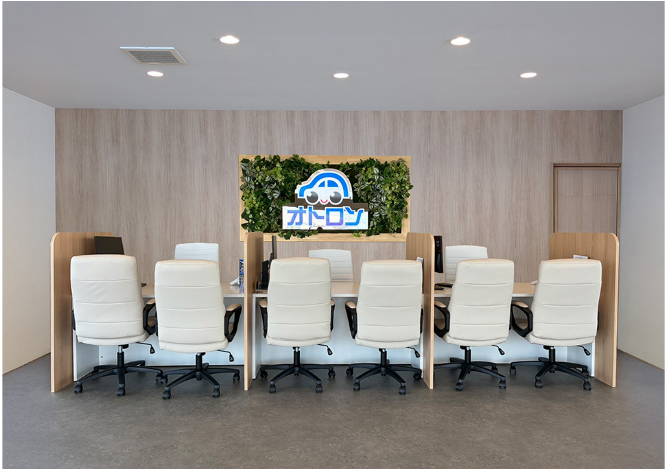
オトロンいわき店(店内イメージ)

車両販売からアフターサポートまでを一貫して行うことで、ご利用いただくお客様に、長期的に安心できるカーライフをご提供します。