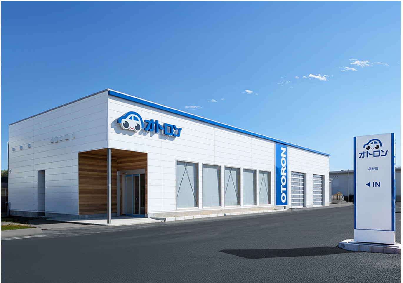
オトロン刈谷店(外観イメージ)