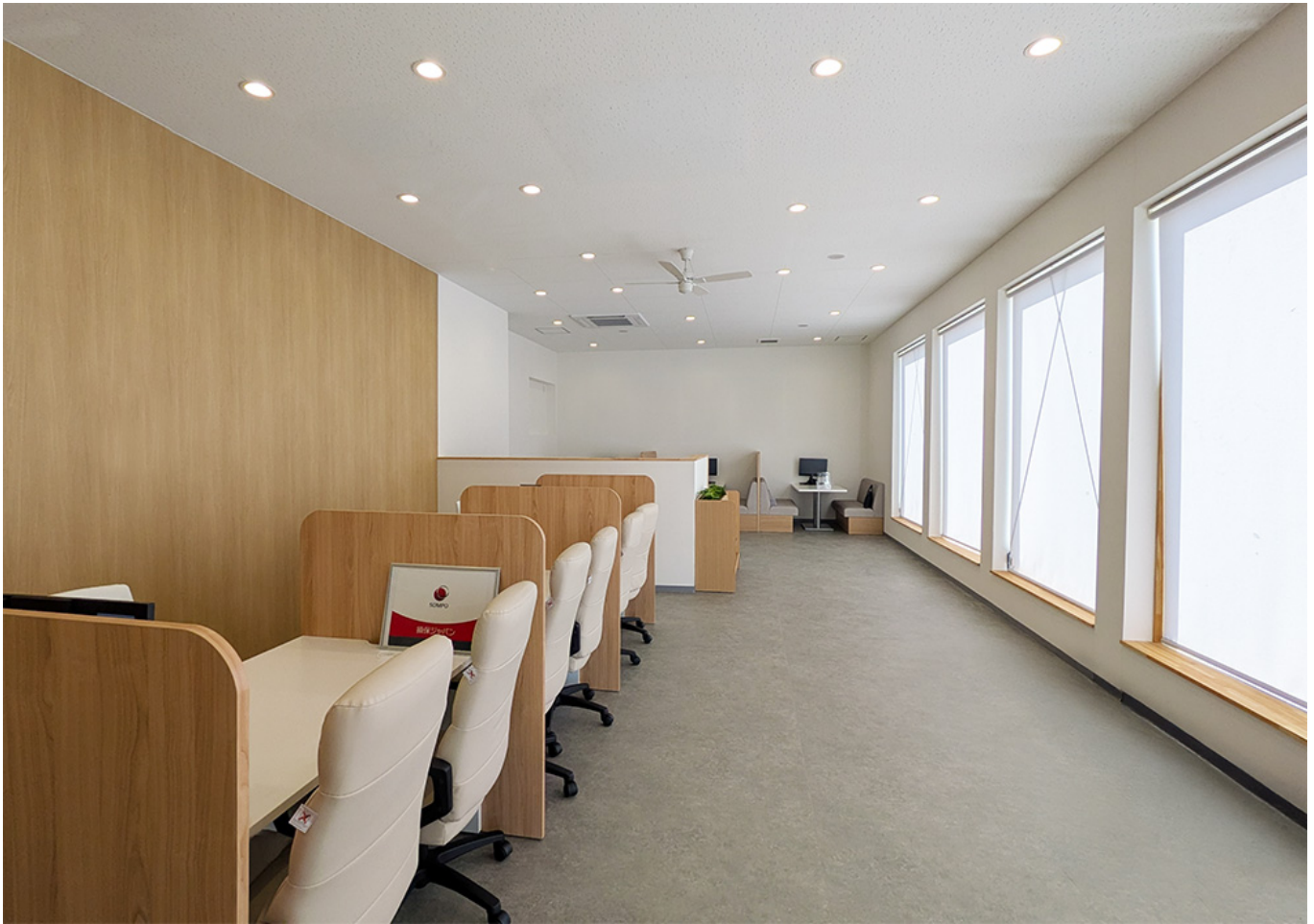
オトロン刈谷店(店内イメージ)