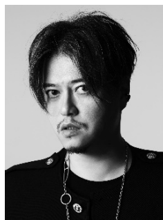
音楽家 渋谷慶一郎

建築家。東京都庭園美術館館長。茨城県生まれ。1981年日本女子大学大学院修了。1987年妹島和世建築設計事務所、1995年西沢立衛とともにSANAAを設立。