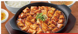
定食はご飯・スープ・漬物付き

唐揚げ2個+ (唐又はタレ) ライスセット +450円 (税込495円) 唐揚げ2個セット+360円(商品386円)もあります。