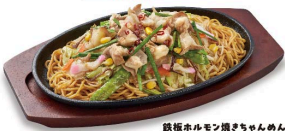
鉄板ホルモン焼きちゃんめん

鉄板肉焼きちゃんめん 唐揚げ(2個)+ライスセット 1,480円 (税込1,628円) 単品 1,030円 (税込1,133円)