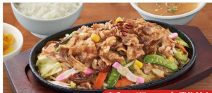
定食はご飯・スープ・漬物付き

鉄板野菜炒め定食 930円 (税込1,023円) 単品 730円 (税込803円)