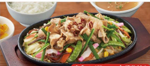
定食はご飯・スープ・漬物付き

鉄板肉野菜炒め定食 1,080円 (税込1,188円) 単品 880円 (税込968円)