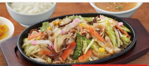
定食はご飯・スープ・漬物付き

鉄板麻婆豆腐定食 1,080円 (税込1,188円) 単品 880円 (税込968円)